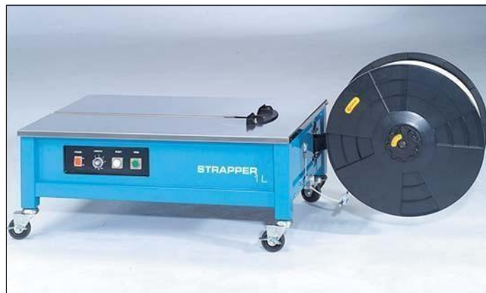
STRAPPER 1 L, especial sobremesa 372 mm.